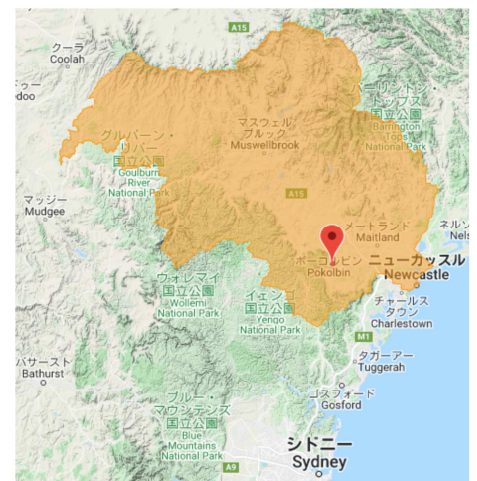
ハンター・ヴァレーとマウント・プレザント

*年号や価格は予告なく変更することがございます。 *各ワインの詳しい資料は弊社ホームページ上の生産者 ワイン詳細をご参照ください。（2023年12月） ヴィレッジ・セラース株式会社