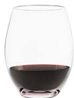
レッドA (ステムレス) Red A (Stemless)