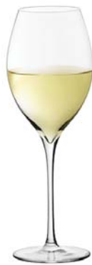
ホワイトA (ハンドメイド) White A (Handmade)