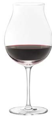
レッドB Red B