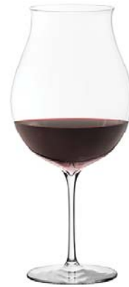
レッドB (ハンドメイド) Red B (Handmade)