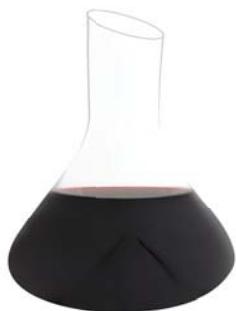
フリンダーズ・ミニ Flinders Mini