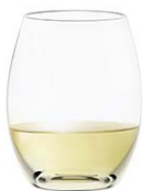
ホワイトA (ステムレス) White A (Stemless)