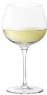
ホワイトB White B