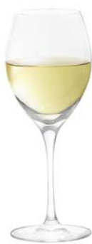
ホワイトA White A