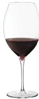
レッドA (ハンドメイド) Red A (Handmade)