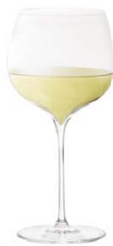
ホワイトB (ハンドメイド) White B (Handmade)