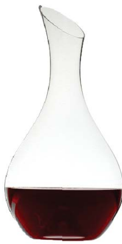
スプリング (2ltr) Spring 2ltr