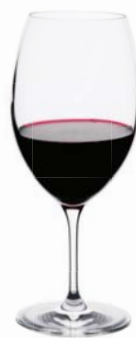
マルチレッド Multi Red