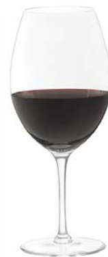
レッドA Red A