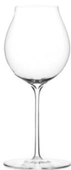
シャンパーニュ (ハンドメイド) Champagne (Handmade)