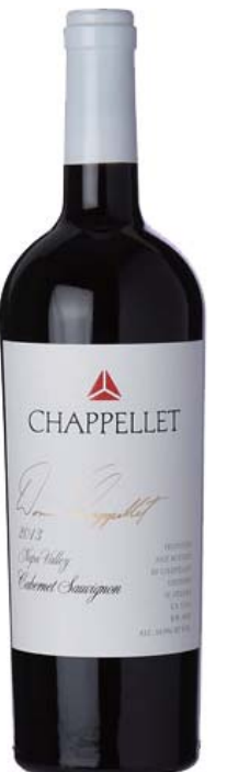
シグニチャー カベルネ・ソーヴィニオン

プリチャード・ヒルは赤い花崗岩を多く含む火山性土壌。力強い凝縮したダークフルーツの果実味はしなやかで、細やかなタンニンがストラクチャーを形成。70年代から続くシャペレのフラッグシップワイン。